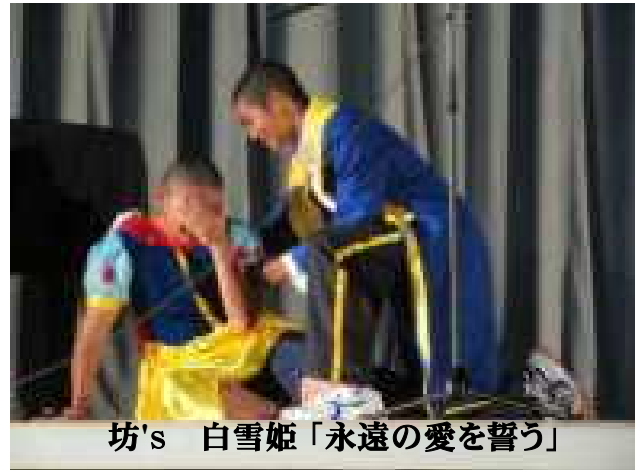
坊's 白雪姫「永遠の愛を誓う」