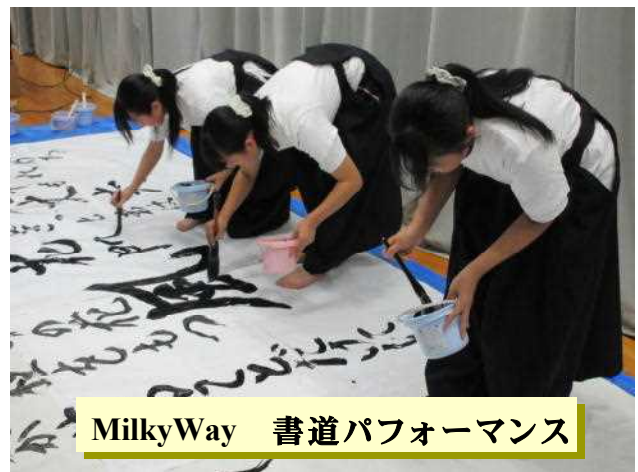
MilkyWay 書道パフォーマンス