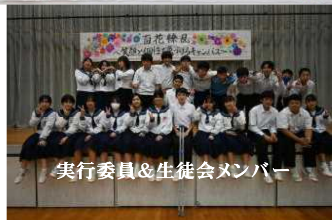
実行委員&生徒会メンバー

文化祭の縮小や入場制限など、様々な制約からようやく本来の姿に戻り、笑顔・歓声・感動と子どもたちが主役となって充実した文化祭が10月25日に行われました。学年合唱や有志発表の形に切り替えてから3年目を迎えました。合唱ではどの学年も素晴らしい歌声に涙腺が緩む場面もありました。最後の文化祭となる3年生にとっては、この2年間、先輩達の姿を見ながら暖めてきた熱い思いが開花し、リーダーシップ、パフォーマンスともに素晴らしい力を発揮してくれました。感謝の気持ちと共に一分一秒無駄にすることなく、自分の成長を大切にこれからの学校生活を送ってほしいと思います。