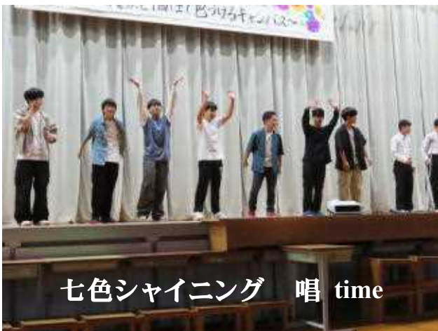
七色シャイニング 唱 time