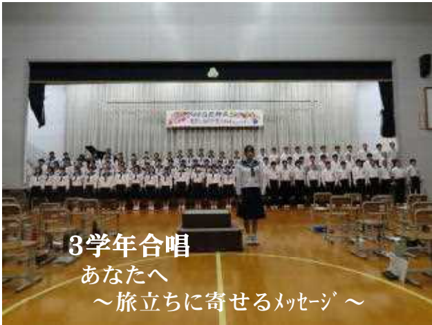
3学年合唱 あなたへ ～旅立ちに寄せるメッセージ～