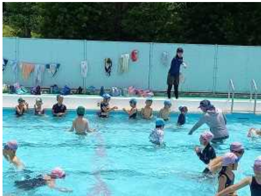
低学年 1年生は初めてのプール

夏休み中のプール開放はありませんが、民間のプールや海水浴、川遊び等に行く場合は、水難事故には十分気をつけ、楽しんでほしいと思います。また、子どもたちだけで川、海、用水路、ため池等で絶対に遊ばないように、ご家庭でも協力をお願いします。