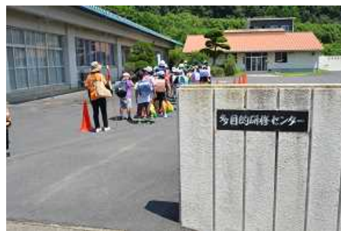
多目的研修センターへ避難