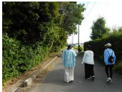
学校近くの通学路 雑木が歩道や車道に…